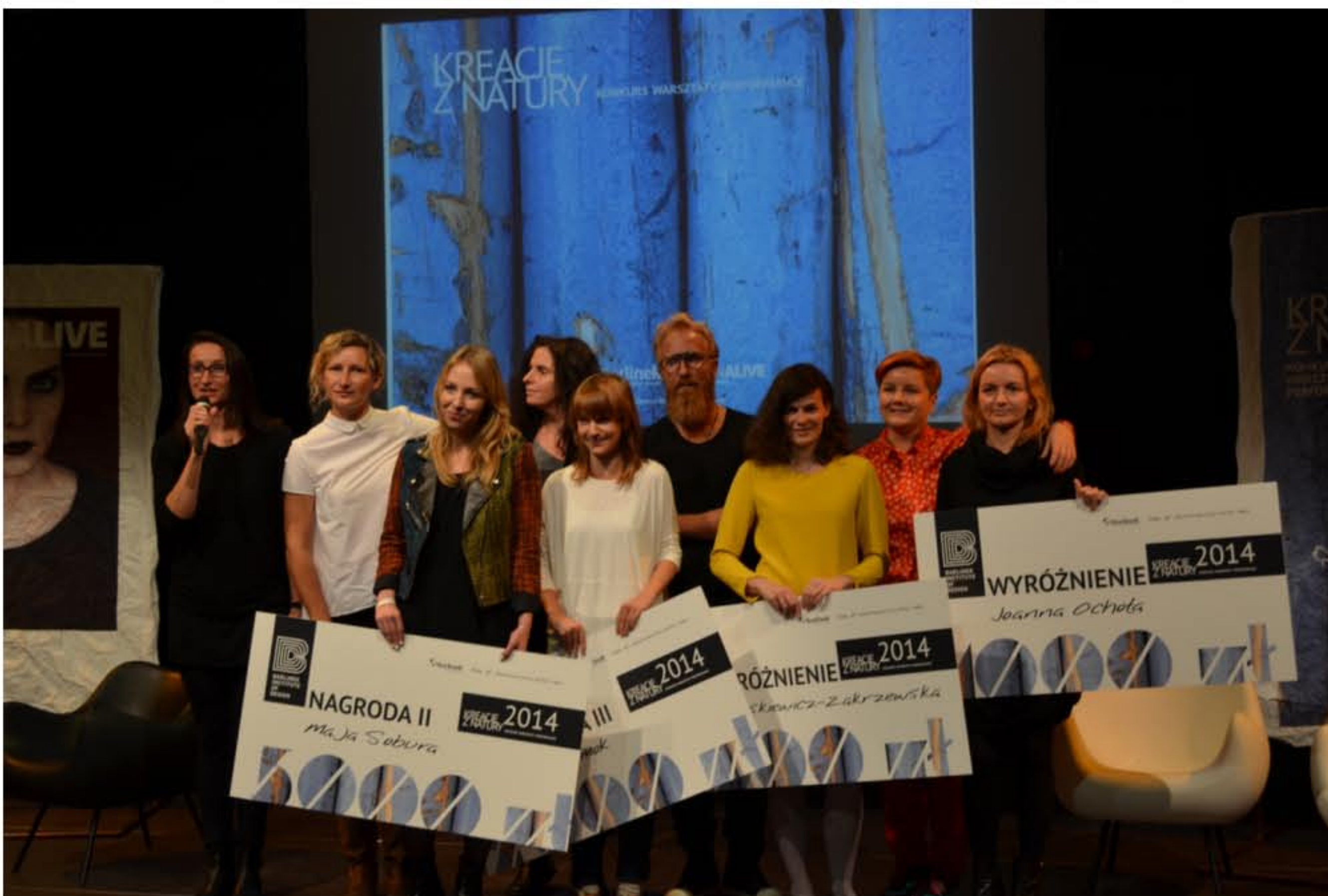
PAMIĄTKOWE ZDJĘCIE LAUREATÓW, JURORÓW I ORGANIZATORÓW KONKURSU, KTÓRY MIAŁ SWÓJ FINAŁ W MINIONĄ SOBOTĘ W RAMACH DESIGN ALIVE TALKS: BRAVE NEW CLIENT PODCZAS ŁÓDZKIEGO FESTIWALU DESIGNU.